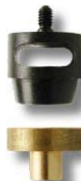
Fustella per pellami

Sono disponibili in tutte le misure necessarie all'applicazione dei nostri occhielli e rivetti