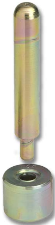
PUNZONE A MARTELLO