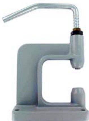
N2 – N4 – N5