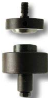
Applicatori per occhielli

Per tutti i nostri occhielli possiamo fornire i relativi applicatori; OGNI APPLICATORE E' TESTATO PER GARANTIRNE IL PERFETTO FUNZIONAMENTO