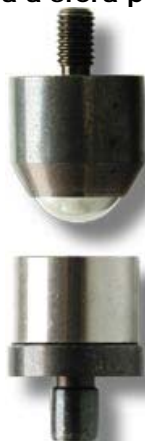
Fustella a sfera per tessuti

Le fustelle a sfera sono ideali per forare i tessuti; realizzano un taglio netto e senza fili. Sono disponibili in tutte le misure necessarie all'applicazione dei nostri occhielli e rivetti