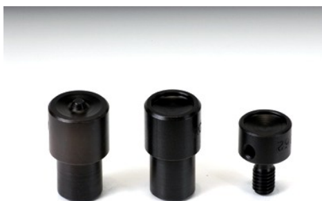
Applicatori per rivetti

Applicatori per rivetti tubolari calottati e non. Sono disponibili per tutte gli articoli