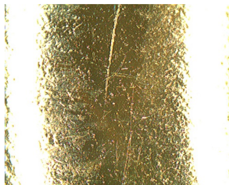
Fotografie microscopiche di superfici “lux ®”