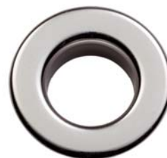
NICHEL LUX ® FREE