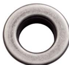
ARGENTO ANTICO FREE