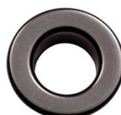
NICHEL NERO LUX ® FREE