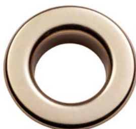
ORO CHIARO LUX ®