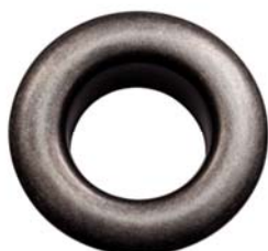
NICHEL ANTICO FREE