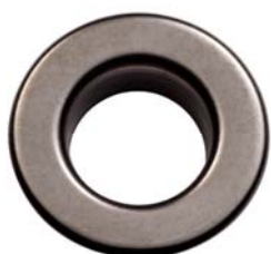
NICHEL NERO OPACO FREE